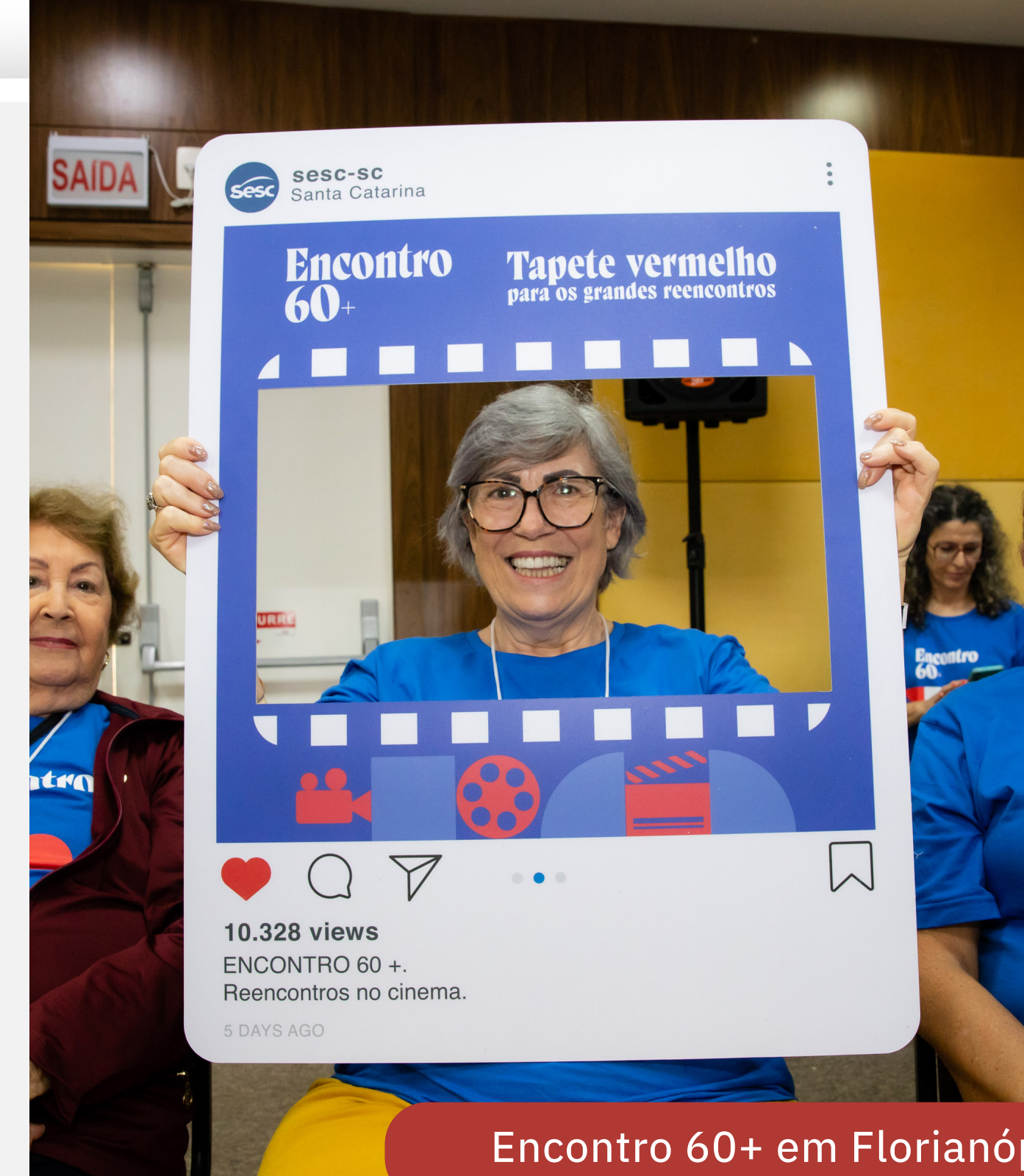
Encontro 60+ em Florianópolis

Ela destacou o pioneirismo do Sesc em realizar o Trabalho Social com Idosos (TSI). “Estamos chegando aos 60 anos de atuação, ou seja, o TSI também é 60+. As atividades iniciaram em 1960 no Sesc São Paulo, e em 1977 em Santa Catarina, pela unidade Sesc Estreito de Florianópolis”, conta.