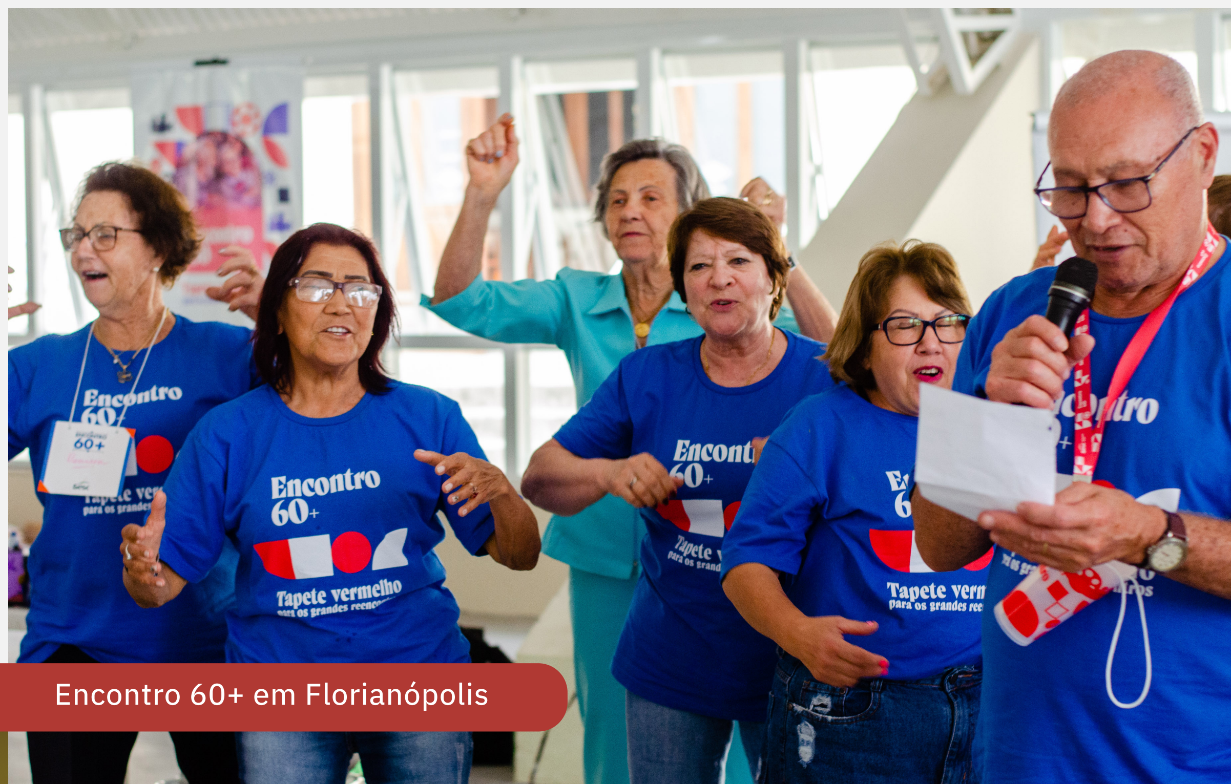
Encontro 60+ em Florianópolis

O evento em Florianópolis proporcionou bons momentos de interação social para 225 participantes de grupos de idosos do Sesc, que vieram de várias regiões do Estado. E teve mais, de 8 a 10/11, na Pousada Rural Sesc Lages, com oficinas, gincana, apresentações artísticas, baile e muita integração.