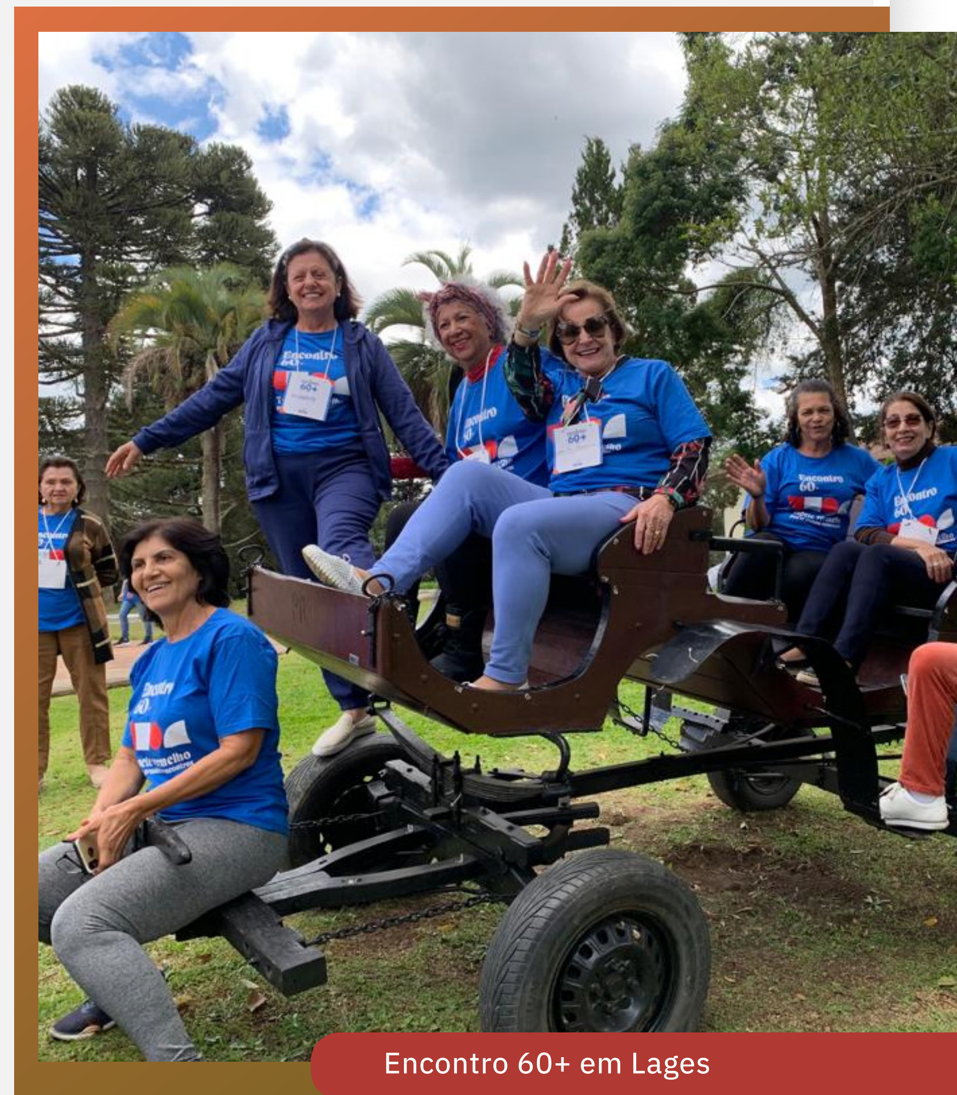
Encontro 60+ em Lages

Em clima de cinema, os protagonistas foram recebidos com todo o prestígio que merecem. Em Florianópolis, os idosos puderam participar de oficina de cerâmica “Calçada da fama”; oficina de expressão corporal “Corpo presente”; oficina de Dança Circular “Dançando o Cinema”; oficina de fotografia com smartphone “Cine Retrato”; Oficina de cantoria e musicalização “Cine Musical”; exibição do documentário “As rendas de Dinho”, com roda de conversa; Gincana do Oscar, com muitas atividades divertidas e premiação para os participantes. Além do esperado baile de confraternização “No Escurinho do